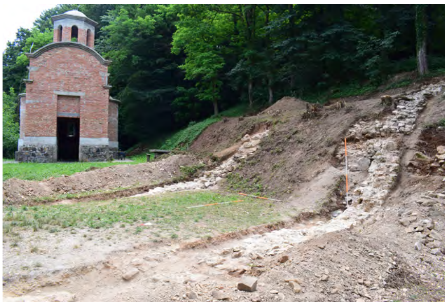
Сл. 5. Објекат 1 западно од цркве, снимак са северозапада