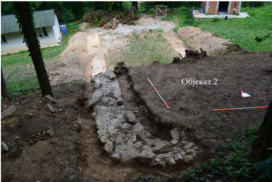
Сл. 8. Западни зид и југозападни угао Објекта 2, снимак с југа