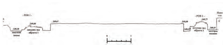
Сл. 6. Пресек кроз ровове 1 и 2 (Објекат 1)