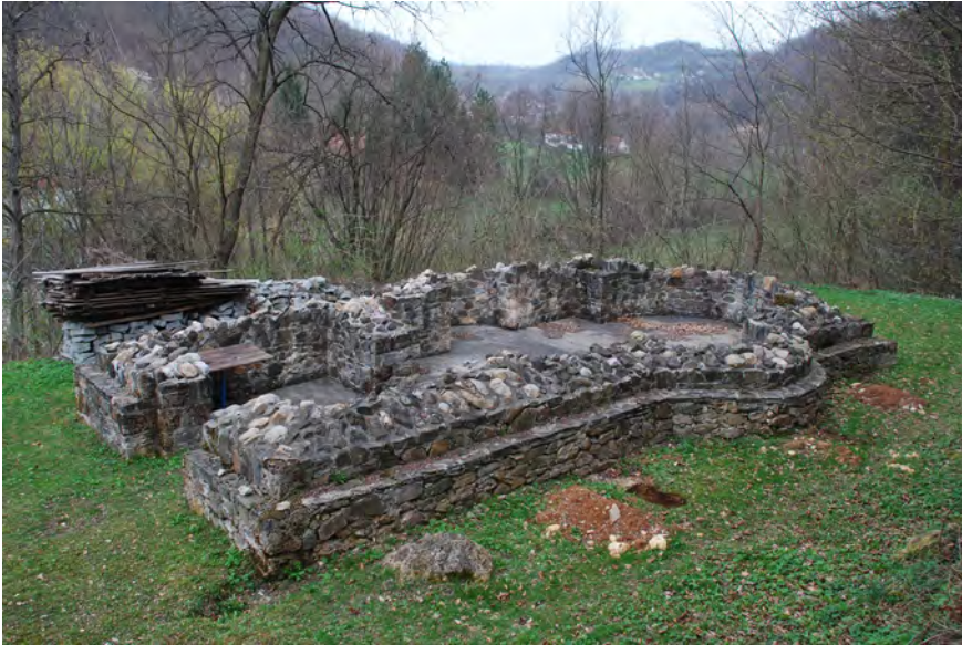
Сл. 2. Конзервирани остаци цркве (фото: Д. Радичевић, 2012)