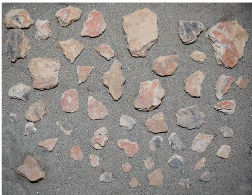
Сл. 7. Фрагменти фресака из Објекта 1