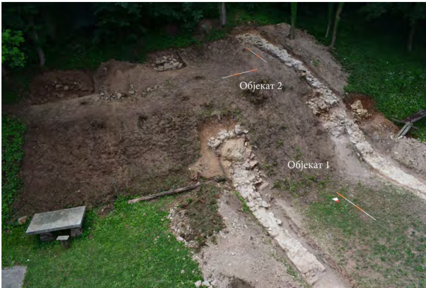
Сл. 3. Површински откривени зидови манастирских зграда, снимак са североистока